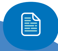
Weitere Dokumente Ihrer Wahl